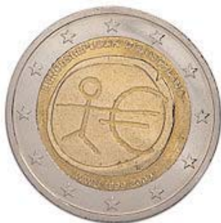
Europaweit einheitliche Sondermünze, zum 10-jährigen Jubiläum des Euros

Um eine Stabilitätsgemeinschaft wie die EWU errichten zu können, war das Vorhandensein von monetärer und fiskalischer Konvergenz von Anfang an unbedingt erforderlich. Demzufolge wurden das Fundament für die Auswahl der Teilnehmer an die Konvergenzkriterien gemäß Artikel 121 des Vertrages zur Gründung der Europäischen Gemeinschaft (EG-Vertrag), die sog. Maastricht-Kriterien, geknüpft. Diese Regularien sollen sicherstellen, dass nur die Länder der EWU beitreten, welche fortwährend die Hauptziele der Europäischen Währungsunion unterstützen und sich in ihrer wirtschaftlichen Entwicklung ähnlich sind (Konvergenz = Annäherung, Übereinstimmung).