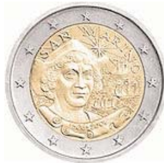
San Marino: Zwei-Euro- Münze zum 500. Todestag von Christoph Columbus