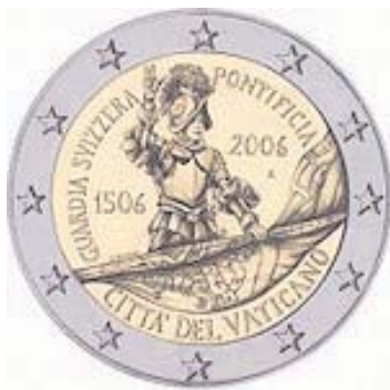
Vatikanstaat: Zwei-Euro- Münze zum 500. Jahrestag der Gründung der Schweizer Garde

Im Zuge seiner Unabhängigkeitsbemühungen hatte Montenegro einseitig die Deutsche Mark als Währung eingeführt. Im Kosovo wurde die DM nach dem Ende des Kosovo-Krieges von der UNO-Verwaltung als Währung eingeführt. Nach deren Abschaffung führten beide den Euro als gesetzliches Zahlungsmittel ein (Montenegro ist seit dem 3. Juni 2006 ein unabhängiger Staat, der Kosovo betrachtet sich seit dem 17. Februar 2008 ebenfalls als unabhängig). Allerdings wurde bisher kein Abkommen mit der EU über eine Einführung des Euros abgeschlossen. Dies ist seitens der EU auch nicht angestrebt, sodass Montenegro und Kosovo weder Einfluss auf die Geldpolitik der EZB nehmen können noch Euromünzen prägen dürfen.