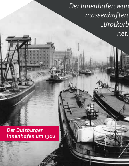
Der Duisburger Innenhafen um 1902

Der Innenhafen wurde früher wegen des massenhaften Getreideumschlags als „Brotkorb des Ruhrgebiets“ bezeichnet. Mit dem Niedergang der Getreidemühlen Ende der 1960er Jahre war dann auch der Niedergang des damaligen Duisburger Innenhafens unvermeidlich. Ab Mitte der 1990er Jahre begannen dann die Umwandlungsarbeiten nach Plänen des britischen Stararchitekten Sir Norman Foster.