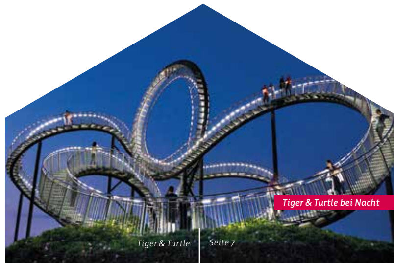
Tiger & Turtle bei Nacht

Ehinger Straße 117 | 47249 Duisburg www.tigerandturtle.duisburg.de