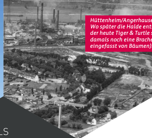
Hüttenheim/Angerhausen, um 1965: Wo später die Halde entstand, auf der heute Tiger & Turtle steht, ist damals noch eine Brache (Im Foto eingefasst von Bäumen).