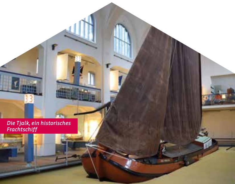
Die Tjalk, ein historisches Frachtschiff

Das heutige Museum befindet sich in einem ehemaligen Jugendstilhallenbad. Es eröffnete 1910 und hatte zwei Schwimmhallen. Eine für Männer und eine für Frauen. Die Hausordnung war streng. So hieß es zum Beispiel: „Hühneraugenoperationen dürfen in der Anstalt nicht vorgenommen werden.“