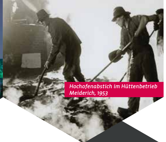
Hochofenabstich im Hüttenbetrieb Meiderich, 1953