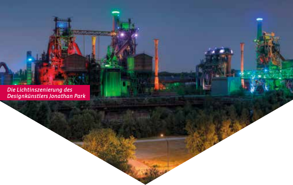
Die Lichtinszenierung des Designkünstlers Jonathan Park