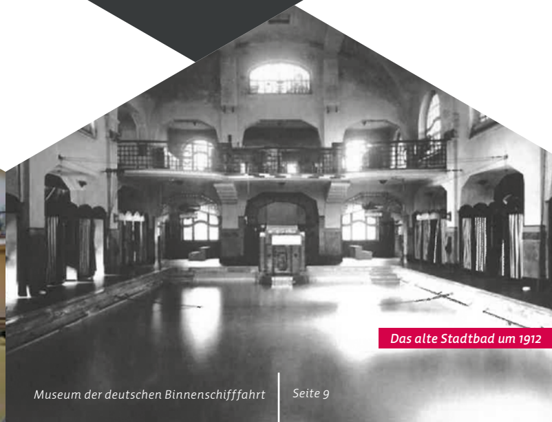
Das alte Stadtbad um 1912