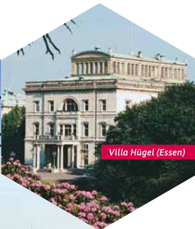
Villa Hügel (Essen)