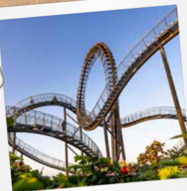
TIGER & TURTLE