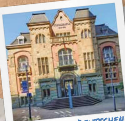
MUSEUM DER DEUTSCHEN BINNENSCHIFFFAHRT

Leinen los! Multimedial, mit detailgetreuen Modellen sowie Exponaten zum Anfassen verkehrst du in der ehemaligen Badeanstalt durch die Geschichte der Deutschen Binnenschifffahrt. Übrigens: Es gibt kein umfassenderes Museum dieser Art in ganz Deutschland.