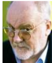
Hanns Dieter Hüsch †