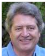
Christian Quadflieg †