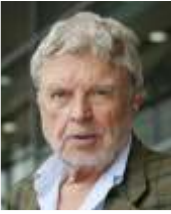
Hardy Krüger †

Hier eine Auswahl einiger der bekanntesten Künstler, die bisher in der „SÄULE“ aufgetreten sind: