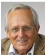
Dieter Hildebrandt †