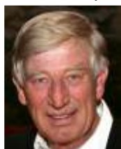
Siegfried Rauch †