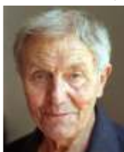
Heinz Bennent †