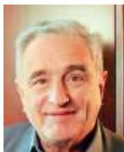
Michael Degen †