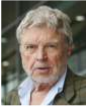
Hardy Krüger †