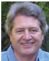
Christian Quadflieg †