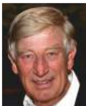
Siegfried Rauch †