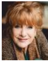
Hannelore Hoger †