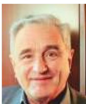
Michael Degen †