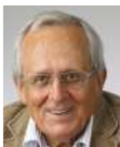
Dieter Hildebrandt †