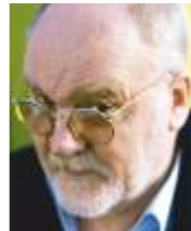
Hanns Dieter Hüsch †