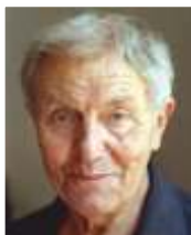
Heinz Bennent †