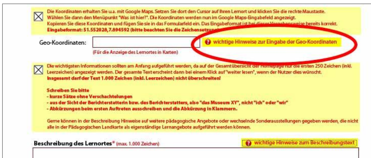
Bild-, Video- und Audiodateien zum Lernort

Um Ihnen das Ausfüllen des Fragebogens zu erleichtern, können an einigen Stellen des Formulars Informationsboxen geöffnet werden. Diese interaktiven Elemente öffnen sich durch einen Klick auf eine entsprechende Hinweistafeln im Dokument: