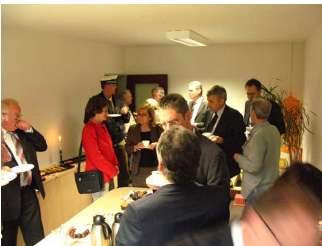
Die Räume des Stadtteilbüros werden interessiert in Augenschein genommen.