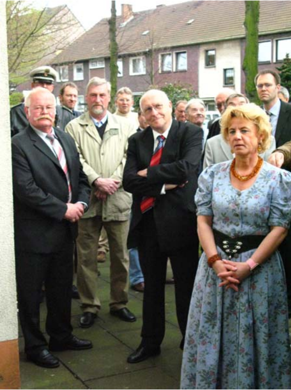
Zuhörende Gäste bei der Eröffnungsansprache des Oberbürgermeisters.