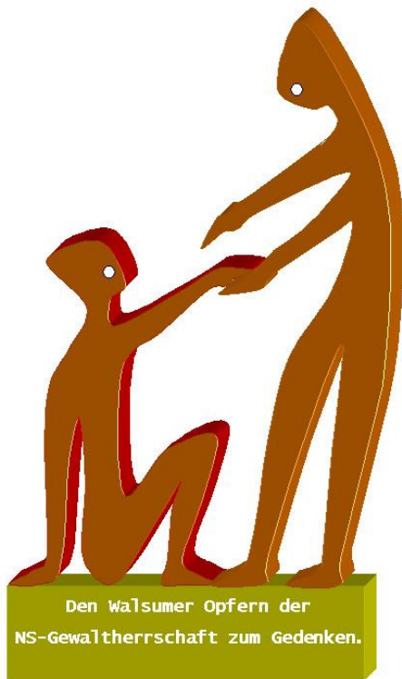
Entwurf: Gisbert Zimmermann

Gisbert Zimmermann der u.a. die stählernen Fußballfiguren an der Schalke-Arena gestaltet hat, setzt auf Schlichtheit. Er will eine etwa zwei Meter hohe Stahlskulptur schaffen, die zwei Personen zeigt - die starke reicht der schwachen die Hand. Mit Hilfe der Thyssen-Ausbildungswerkstatt sollte sich das Kunstwerk kurzfristig realisieren lassen, glaubt er. Er plant auch nur eine kleine Erklärung im Sockel. „Den Walsumer Opfern der NS-Herrschaft zum Gedenken“.