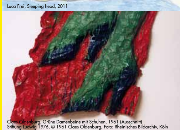
Claes Oldenburg, Grüne Damenbeine mit Schuhen, 1961 (Ausschnitt) Stiftung Ludwig 1976, © 1961 Claes Oldenburg