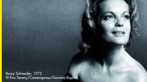
Romy Schneider, 1972