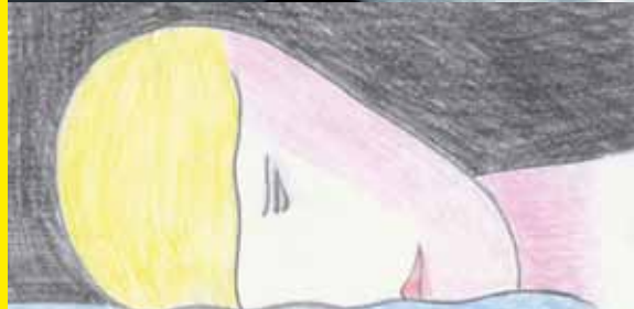
Luca Frei, Sleeping head, 2011