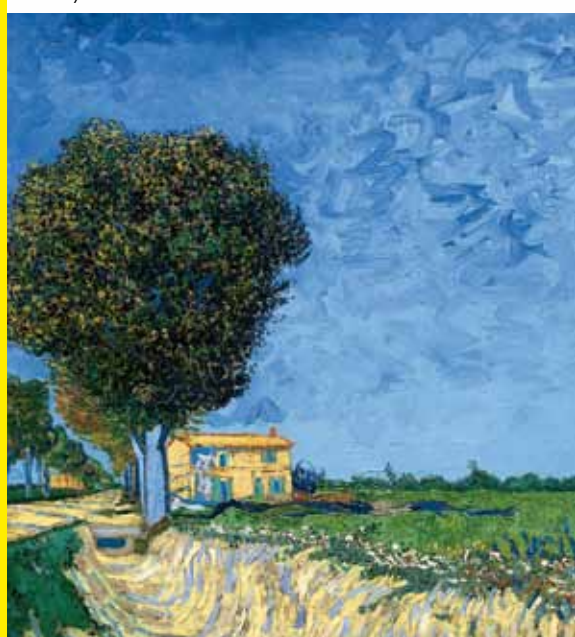
Vincent van Gogh, Allee bei Arles, 1888, Pommesches Landesmuseum, Greifswald