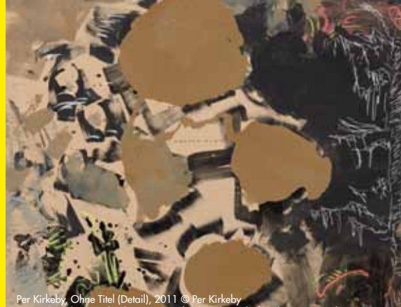
Per Kirkeby, Ohne Titel (Detail), 2011 © Per Kirkeby Courtesy Galerie Michael Werner Märktisch Wilmersdorf, Köln & New York