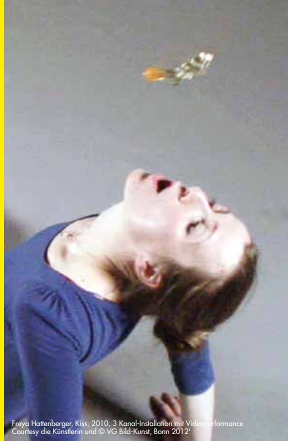
Freya Hattenberger, Kiss, 2010, 3 Kanal-Installation mit Videoperformance Courtesy die Künstlerin und © VG Bild-Kunst, Bonn 2012