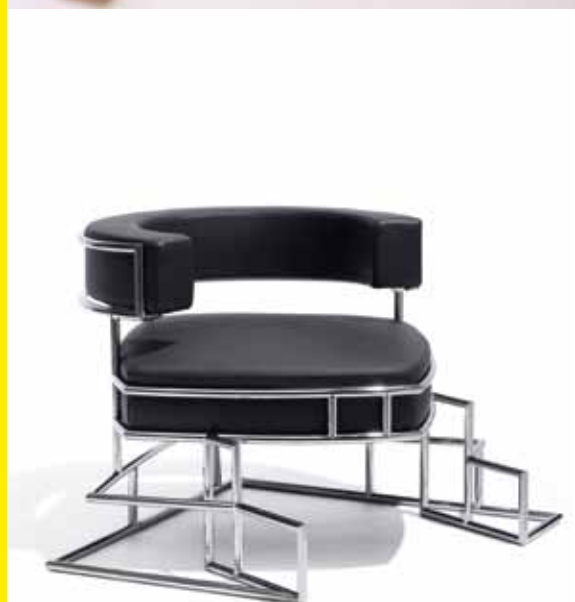
Daniel Libeskind, Armlehnsessel „Torq“, 2010, Sawaya & Moroni, Mailand (I), 2010