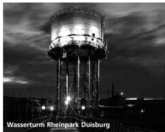
Wasserturm Rheinpark Duisburg

Entstanden ist eine Hommage an die Schönheit des Reviers, mit Fotos und Filmsequenzen,