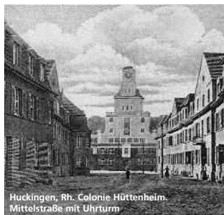
Hückingen, Rh. Colonie Hüttenheim. Mittelstraße mit Uhrturn

Bezirksbibliothek Buchholz Sittardsberger Allee 14