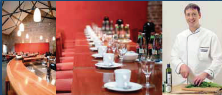
Erholsam: Das „Schiffchen“ ergänzt den Kulturgenuss

Direkt am Museum der Deutschen Binnenschifffahrt, im ehemaligen Kesselhaus, finden Sie das Museumsrestaurant „Schiffchen“. Edles Holz und warme Rottöne machen aus dem Technik-Denkmal einen Ort zum Wohlfühlen und Genießen. Bereichern Sie Ihren Kulturgenuss um ein Stück Erlebnis-Gastronomie. In den Kombi-Paketen für Gruppen sind enthalten: Frühstück oder Kaffeetrinken oder verschie- dene Tagesgerichte und ein Freigetränk.