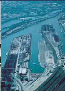
Riesig: Blick über den Hafen