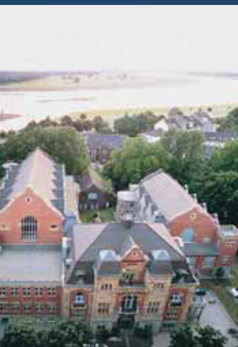
erisch: direkt am Rhein