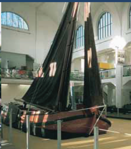
Spektakulär: die Tjalk im Schwimmbecken