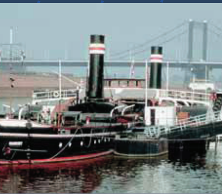
Denkmalwürdig: Oscar Huber erwartet Sie

...volle Schiffbauerarbeit, mächtige Maschinen und faszinierende Technik einer anderen Zeit: Der Radschleppdampfer „Oscar Huber“ und der Eimerkettendampfbagger „Minden“ gehören zum Museum und liegen wenige Minuten entfernt an der Ruhrorter Rheinpromenade. Von Mai bis Ende September können Sie die Schiffe besichtigen und fast alle Bereiche betreten – einschließlich der imposanten Maschinenräume.