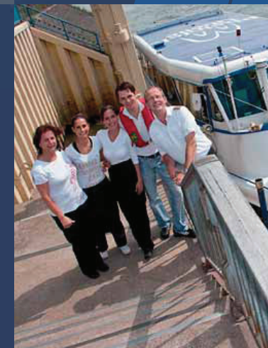
Engagiert: Ruhrorter Personenschifffahrt

Die Hafenrundfahrt ergänzt den Gang durch eine spannen- de Ausstellung perfekt – auf Wunsch und zum günstigen Gruppenpreis.